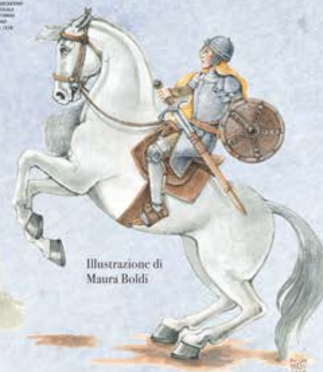
Illustrazione di Maura Boldi